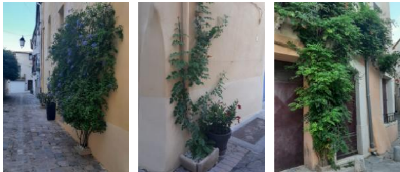
Exemples de végétalisation d'une rue à Mèze

Les travaux de la traverse de Galargues ont permis de vous proposer de réserver des emplacements pour planter des fleurs devant chez vous : vous avez été nombreux à répondre positivement et nous vous en remercions ! Ainsi, plus de trente jardinières sont prévues rue des Anciens Métiers et rue des Lavandières. Concernant l'avenue de l'Abrivado, vous avez encore le temps de nous contacter si vous souhaitez participer puisque les travaux vont démarrer en septembre.